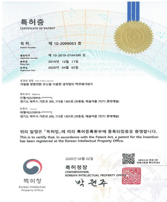
그림 - 2